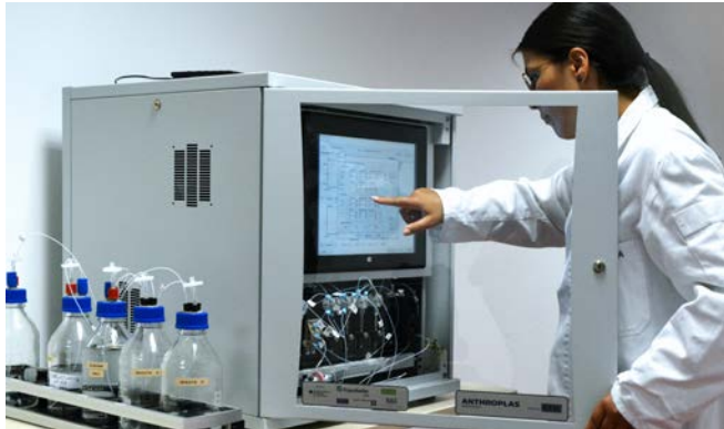
Vollautomatisiertes Analysegerät in der Laborausführung.