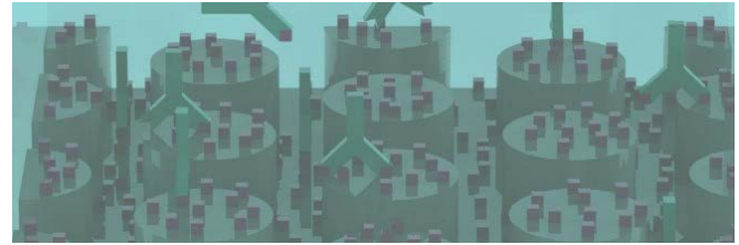
Schema Funktionsprinzip des Biosensors.

Der Biosensor wird mit einem Mikrofluidiksystem und einer miniaturisierten Abfrageelektronik kombiniert, so dass zusammen mit ECH ein vollautomatisches Analysegerät für den prozessintegrierten vor-Ort-Nachweis von Molekülen entstand.