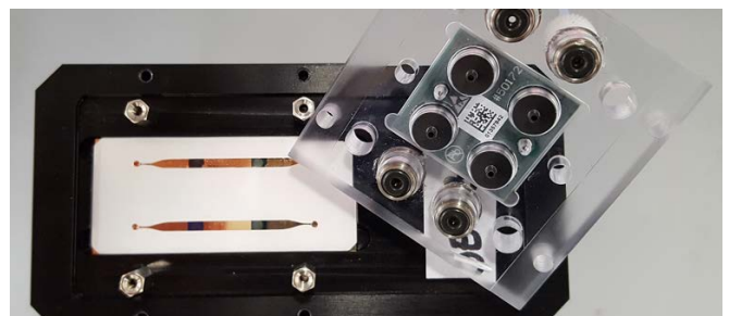
Handgroße Sensoreinheit mit nanostrukturiertem Sensorsubstrat.

Am Beispiel des Arzneistoffs Diclofenac wurde im Konzentrationsbereich von 1 bis 10 \mu\text{g/l} bei einem Messzyklus von 30 min die Eignung des Messgeräts demonstriert. Prinzipiell lassen sich mit dem optischen Biosensor alle Spurenschadstoffe oder auch Kombinationen mehrerer Schadstoffe detektieren. Dafür arbeitet das IKTS an der Erschließung weiterer Analyten in der Umwelttechnik, Wasseraufbereitung, Aquakultur, Lebensmittel- und Pharmaindustrie.